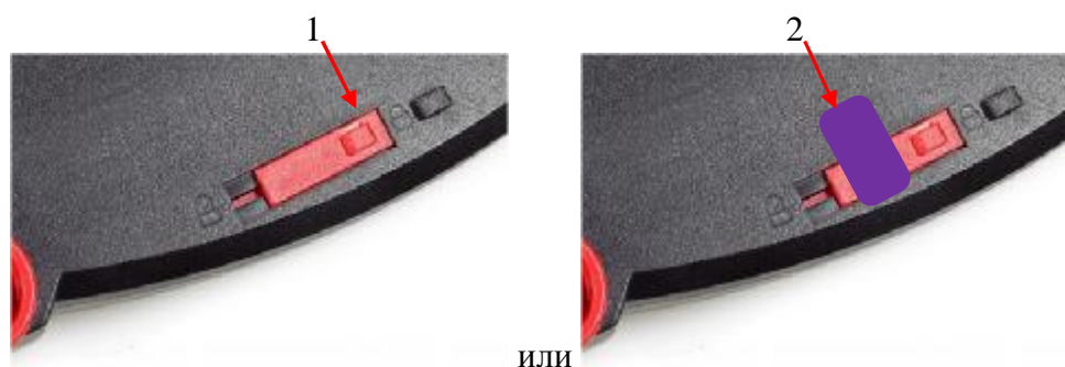
Рисунок 2 – Схема пломбировки от несанкционированного доступа, обозначение места нанесения знака поверки (1 – свинцовая или пластиковая пломба со знаком поверки в виде оттиска поверительного клейма; 2 – пломба, знак поверки в виде разрушаемой наклейки)

Маркировочная табличка весов крепится клеевым способом на нижней или боковой поверхности весов и содержит следующую информацию (рисунок 3):